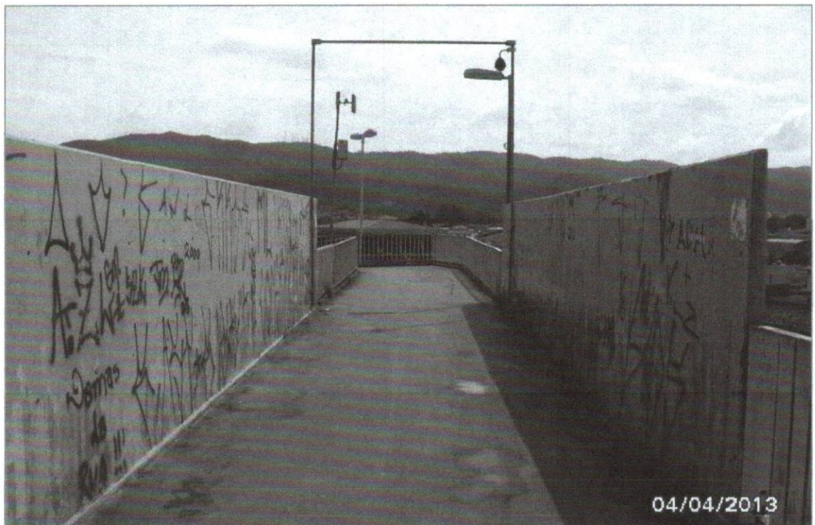
Foto 02: Há muita sujeira nas rampas e entorno da passarela. A fiação da câmera está cortada.